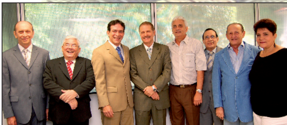
Conselheiros do TCE-PA:

Dos Processos de Prestação e Tomada de Contas, onde houve o descumprimento do prazo estabelecido para remessa ao Tribunal e ressalvas, foram aplicadas multas no valor total de R$ 782.586,94 (setecentos e oitenta e dois mil, quinhentos e oitenta e seis reais e noventa e quatro centavos), que serão destinados com base em Lei para Reparelhamento do TCE-PA.