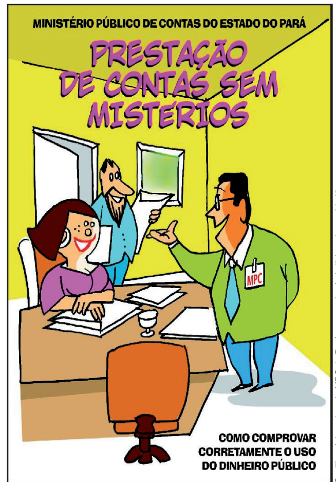
Cartilha elaborada pelo MPC do Pará, que ensina jurisdicionados e cidadãos.

Solicito a Secretaria que de conhecimento desta indicação à Excelentíssima Senhora Governadora do Estado, aos chefes dos Poderes Legislativo e Judiciário ao procurador Geral de Justiça.